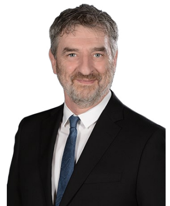
Yves Turgeon , Maire de Saint-Anselme et Élu responsable de la Politique d'accueil et d'intégration des nouveaux arrivants